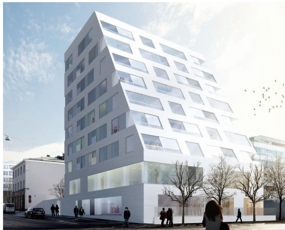
Nybyggnadsprojektet Österbottens hus