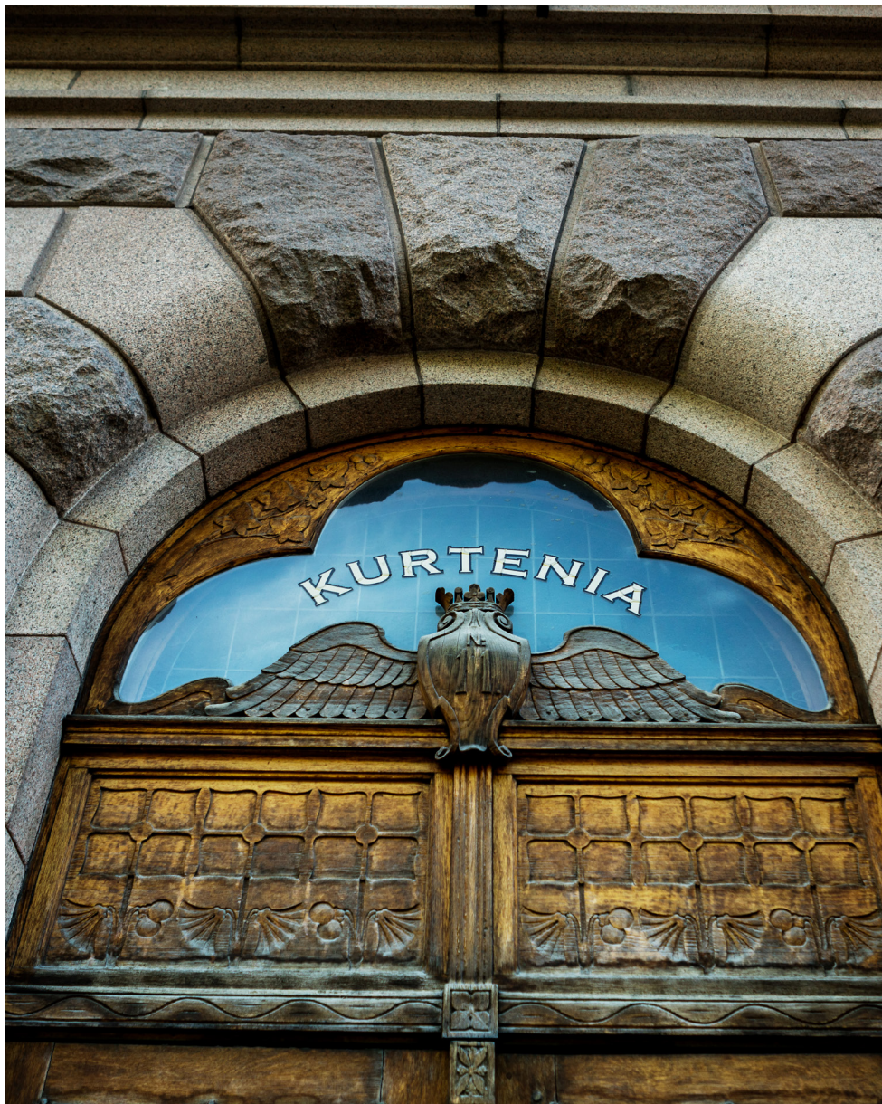
FAB Kurtenia