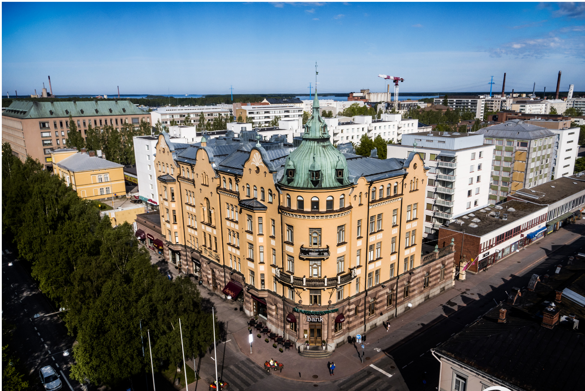
FAB Kurtenia